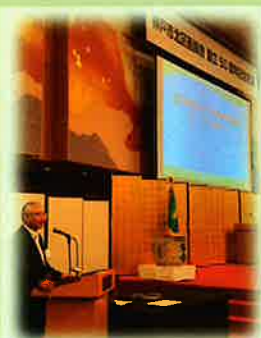
北区医師会50周年 記念式典の様子