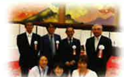
北区医療介護サポートセンターメンバー紹介

令和5年10月21日（土）三田市・神戸市北区・西宮市北部合同研修交流会 令和5年10月23日（月）研修BCP作成の要点とは？（感染症編） 令和5年12月9日（土）市民啓発 第11回神戸市北区健康講座 今後の予定は医療介護サポートセンターのホームページに掲載しています！ ホームページ： https://kobe-iks.net/area/kita