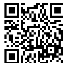
申込み QR コード

※WEB 配信を希望する方は ZOOM 招待メールをお送りするアドレスを下記にご記入ください