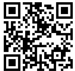
申込み QR コード

※WEB 配信を希望する方は ZOOM 招待メールをお送りするアドレスを下記にご記入ください