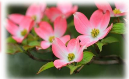
長田区の木 はなみずき